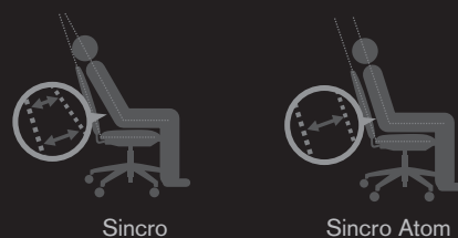
Movimiento del respaldo y cuerpo

Su patentada cinemática a través de un innovador sistema de rodillos genera un movimiento de rotación del respaldo respecto al asiento que sitúa su centro de giro por encima de la superficie del asiento, muy próximo a la cadera del usuario, asegurando de esta manera un acompañamiento perfecto durante el movimiento de reclinación. En ningún momento pierde la espalda el contacto con su apoyo ni sufre el incómodo "efecto camisa".